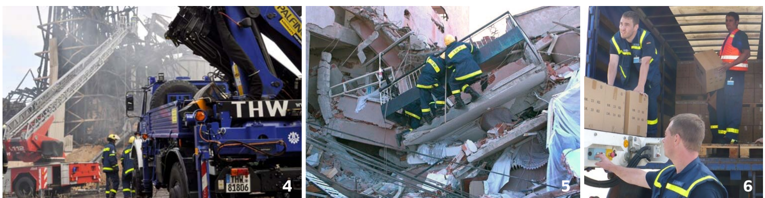
Wald- und Torfbrände (2010): 6 THW-Atemschutzmasken nach Russland